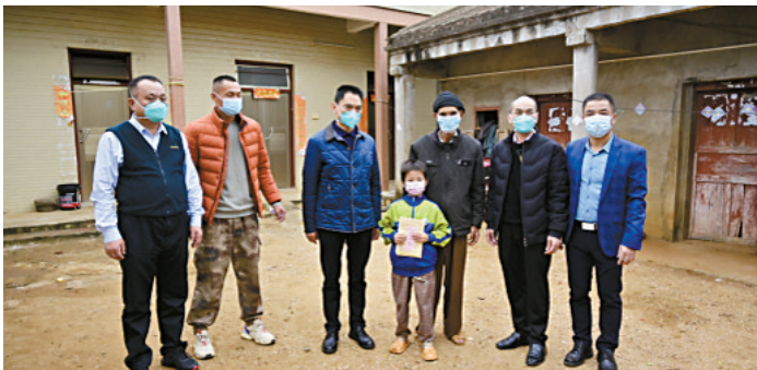
■南沙街道分管领导和南沙街商会爱心企业人士为苞西村相对困难的脱贫户送上慰问金和深切关怀。