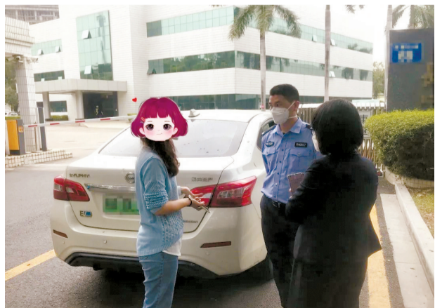
■广州市黄埔警方及时上门劝阻,成功为2名正在遭遇涉疫电信诈骗的群众挽回损失228万元。(资料图)