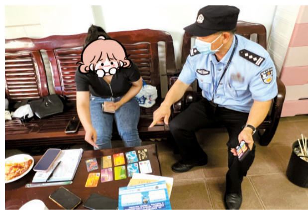
■广州天河警方成功阻断了一场冒充“公检法”电信诈骗局,帮助事主避免了150万元的财产损失。(资料图)