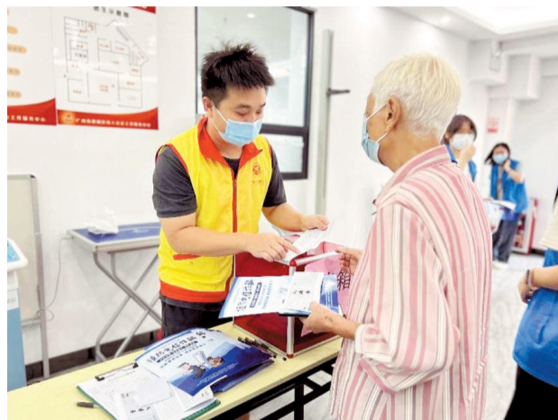
■广州市黄埔区大沙街开展“敬老助老,反诈防骗”宣传。(资料图)