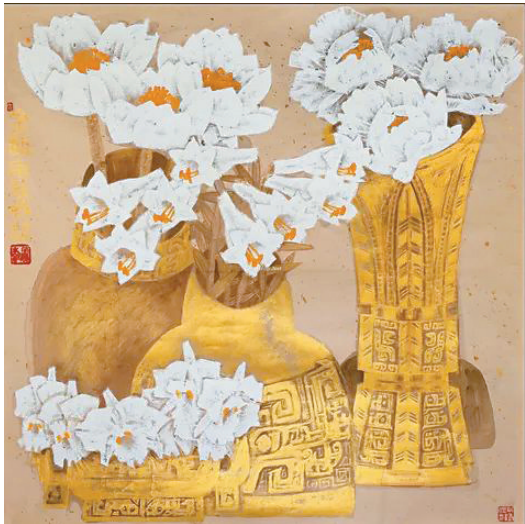
■尚涛作品《金瓯》，1999年获“第九届全国美展”铜奖。

日前，广东画院发布《讣告》，著名国画家、书法家、国家一级美术师，享受国务院政府特殊津贴专家、广东画院画家尚涛同志，因病于2022年12月26日清晨在广州逝世，享年84岁。中国美协主席、中央美院院长范迪安发文表示：“他的逝世，是广东省和中国美术的一大损失。他崇德尚艺、胸怀磊落的艺术风范永驻画坛，让人敬重。”