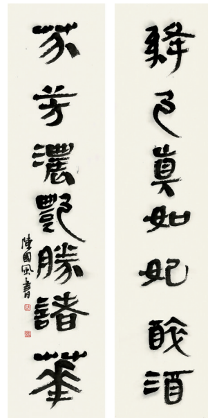
绛色真如妃醉酒 芬芳浓艳胜诸花