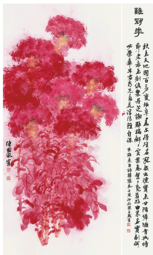
陈春盛题, 陈国锋写