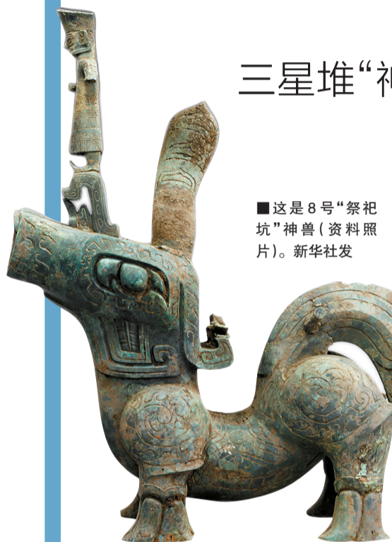
■这是8号“祭祀坑”神兽(资料照片)。新华社发