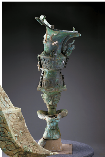
■这是3号“祭祀坑”铜顶尊跪坐人像(资料照片)。新华社发