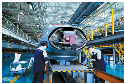
■机械师对动车车钩进行维护保养。