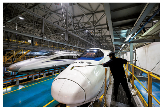
■地勤人员对车组外皮进行清洁作业。