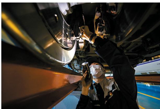
■地勤机械师对车组走行部进行检查,发现故障后要及时报给搭档的班组进行处理。