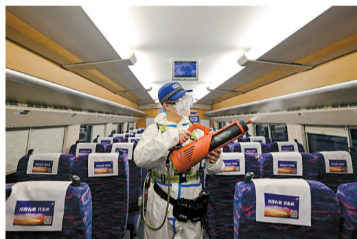
■地勤人员对车厢进行消杀作业。