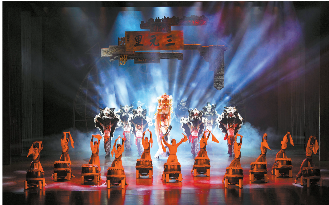
舞剧《醒·狮》已在全国30多个城市巡演。

十年来,广州文艺精品创作捷报频传,荣获国际级奖项二个,国家级奖项400件。去年,18件获评第十二届广东省精神文明建设“五个一工程”奖,位居全省榜首。从问鼎全国精神文明建设“五个一工程”奖的《中国医生》《少年》、鲁迅文学奖《飞发》到吸引超300万人次线上“打卡”的舞剧《醒·狮》,广产舞台精品频频“出圈”。广州市文联主席李鹏程接受收藏周刊记者专访时表示,广州文艺迎来了繁花灿烂的春天。