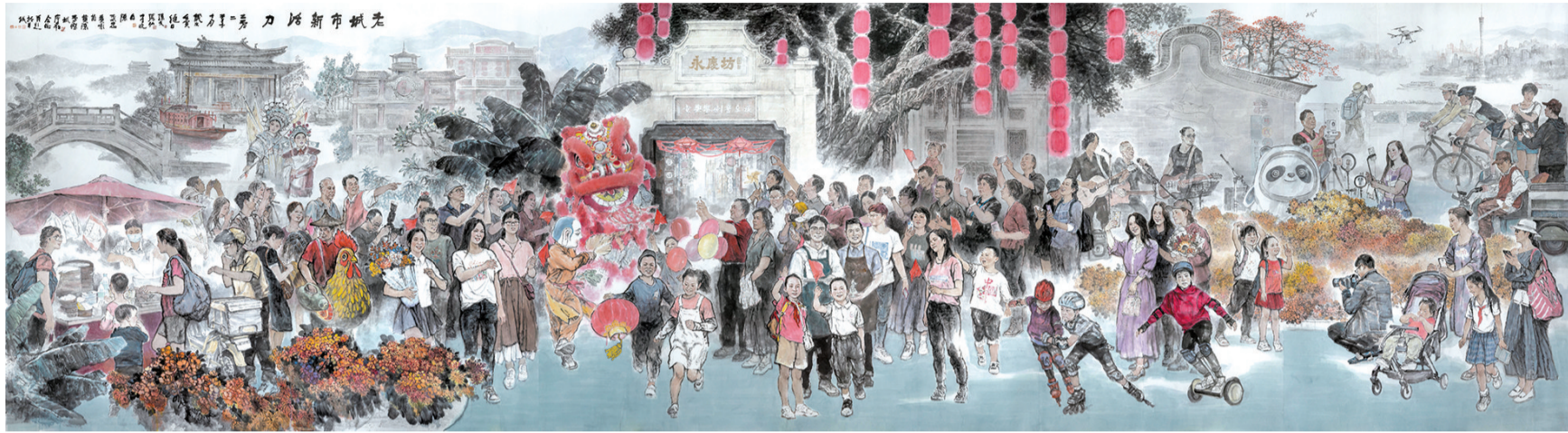
■老城市新活力 策划:广州市文学艺术界联合会,艺术顾问:张绍城,创作人员:廖宗怡、孙戈、张弘、李晓白、陈永忠、黄咏茵、黄陈、麦杰斌

老榕树、舞狮、趟梳门、冰墩墩、无人机等传统与现代元素交织。画面展现老幼妇孺和各行各业欢乐的人们。画家用中锋勾勒人物外轮廓,侧锋、逆锋等技巧对衣物进行皴擦点染,墨线劲道有力而变化多端,墨色层次丰富而厚重沉稳。喜庆的灯笼、鲜花、舞狮等将写意人物画的诗情画意表现得淋漓尽致。这幅长9米,高2.4米的巨幅中国画,作为一幅学习宣传贯彻党的二十大精神大型主题性集体创作,由广州市文学艺术界联合会策划,《老城市新活力》将在“前进号角——广州文艺高质量发展主题大展”展出,用绘画的方式全面呈现广州的历史文化与新时代新活力。