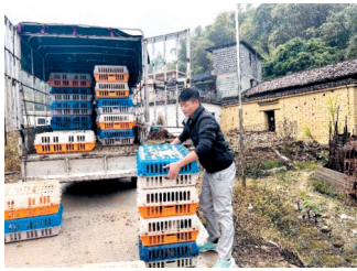
■顺德区驻古水镇工作队节前慰问送鸡苗。