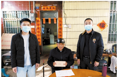
■广州驻清远西牛镇工作队春节前夕慰问困难家庭。