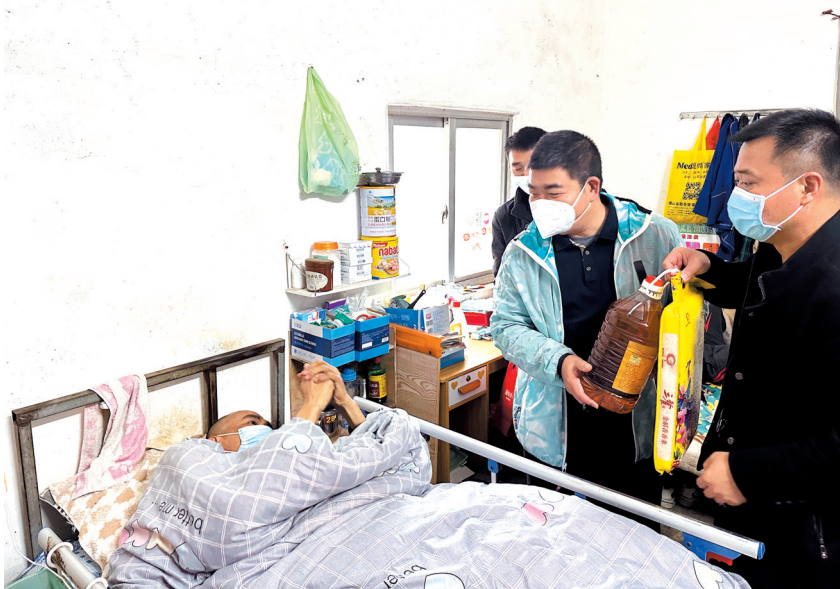
■广湛指挥部到农户家调研走访。