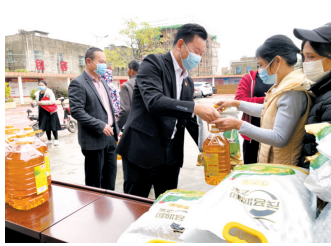
■珠海帮扶单位组团前往茂名市电白区岭门镇开展新春“送温暖”活动。