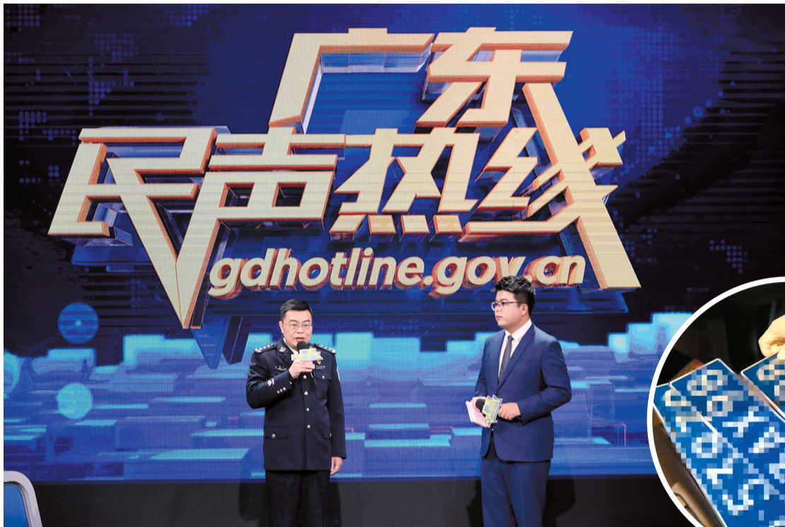
■广东省公安厅党委副书记、常务副厅长杨日华上线“广东民声热线”。

另外，值得注意的是，当前正处于春运高峰期，广东省公安厅交管局局长邓正雨表示：“在1月7日到17日的这段时间里，全省道路平安有序，道路交通安全事故非常平稳，拥堵现象比往年减少。”为确保春运交通安全畅通，邓正雨介绍，广东省公安厅大力消除安全隐患，对广大驾驶员，尤其是重点驾驶员开展安全教育，对重点车辆进行安全检查，对运输企业压实主体责任。在保通保畅方面，与保险公司一起开通线上的理赔，在高速公路设置131个现场理赔点，方便群众处理轻微事故。同时坚决打击交通违法行为，重点查处酒驾、三超一疲劳以及占用应急车道等严重的违法行为。“我们开通了全省一体化的应急处置机制，为路上的群众提供急需之服务，只要打110，我们全省同步运作，尽快赶到现场为群众提供服务。”邓正雨说道。