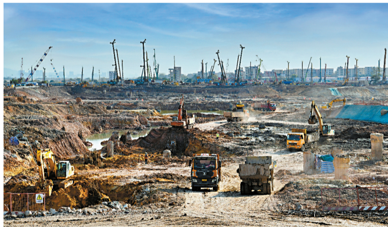
■白云机场三期扩建工程施工现场。

白云机场三期扩建工程是中国民航、广东省和广州市的重点建设项目,也是中国民航历史上规模最大的