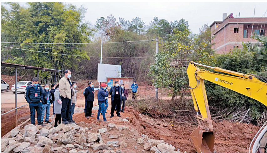
■黄坑镇组织基层人大代表现场视察稳粮保供项目建设情况。

溉用水多无法自流到田地。有的村庄虽然有河流经过,但因河床较深,需要用电灌站将水由低处抽至高处,建设、维护成本较高,黄坑、耶溪、社前等村的电灌站建设都存在不同程度的缺口。