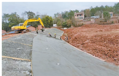
■病险山塘除险加固施工现场。