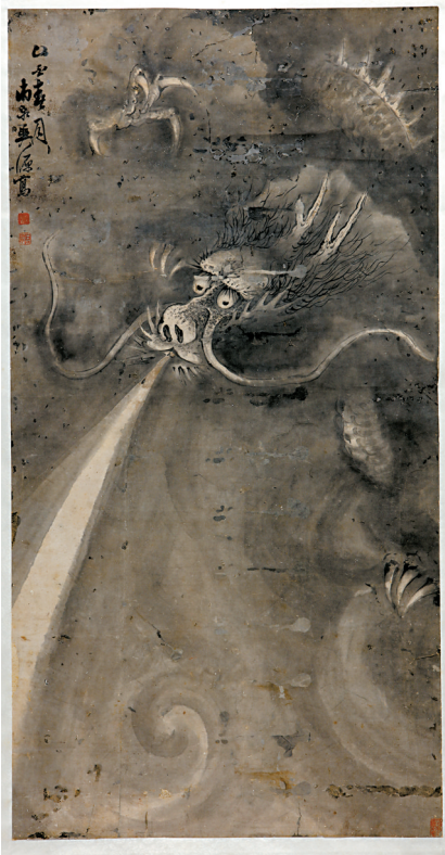
■清吴南泉墨龙图轴。