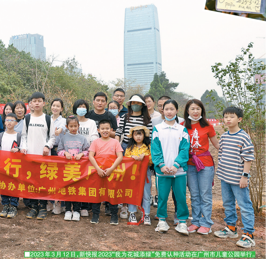
2023年3月12日,新快报2023“我为花城添绿”免费认种活动在广州市儿童公园举行。