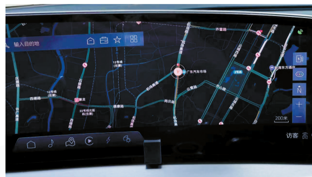
■云先生的车在广州市天河立交,导航却显示在机场路。