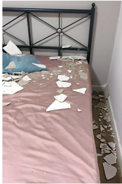
■天花板碎片散落在床上和地上。