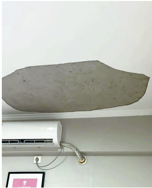
■脱落的天花板直径约1米。