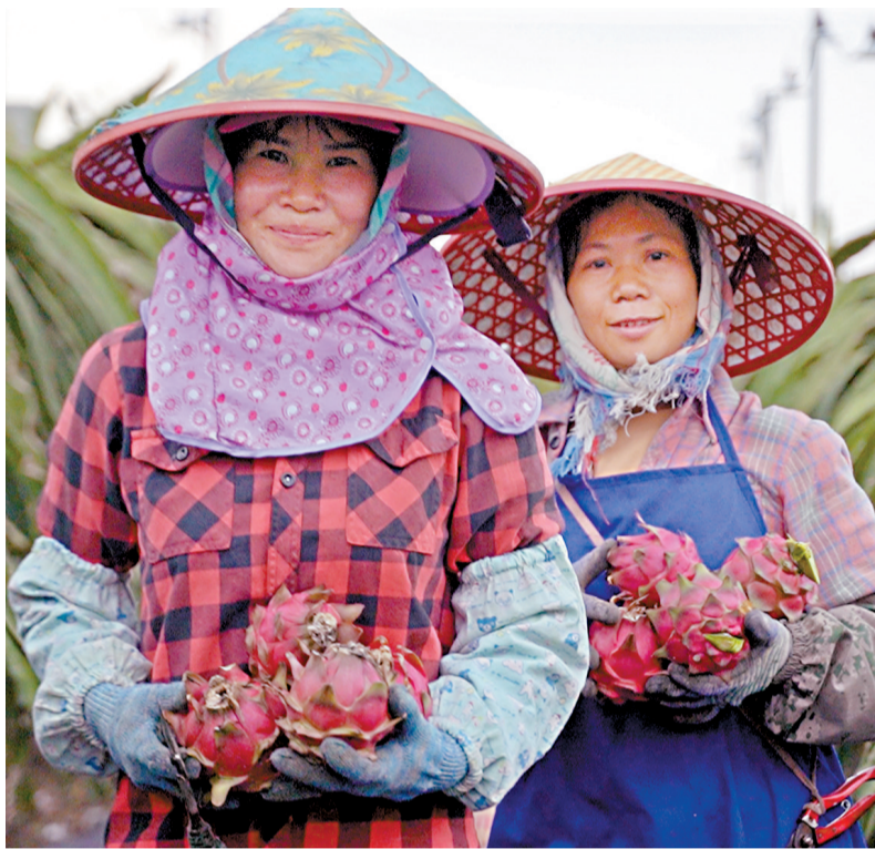
■广西火龙果的走俏,不仅增加了种植户的收入,同时也有效利用了农产区的闲散劳动力,带动更大范围的农户增收。