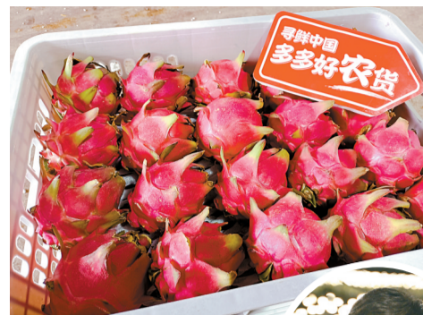
▲火龙果吃起来肉质细腻、味道甜润、口感爽脆。