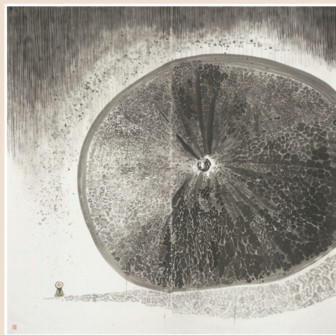
■易柏霖《哈密瓜沉思录 Meditations on a Cantaloupe》 248cmx248cm,纸本设色,2022年