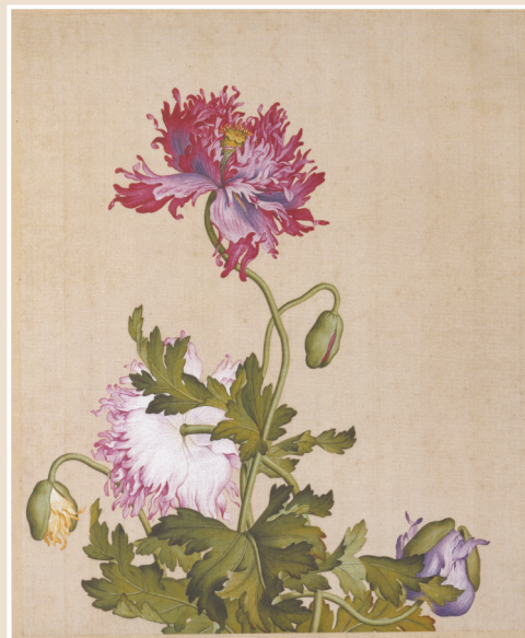
■清·郎世宁《仙萼长春图》,天津博物馆藏