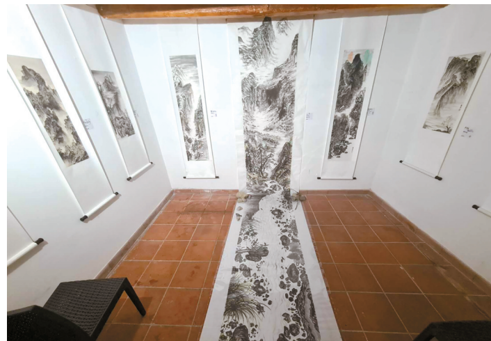
■贾客暮 2022年在 意大利举 办的中国 画展览。

在西方世界，很少有艺术家练习中国画，但练习水墨画的人则很多。我正在努力创建一个国际网络，它像一个共同的核心——中国艺术世界，可以在杂志上找到它的表达，这是一个开放和自由的平台，每个人都可以访问。