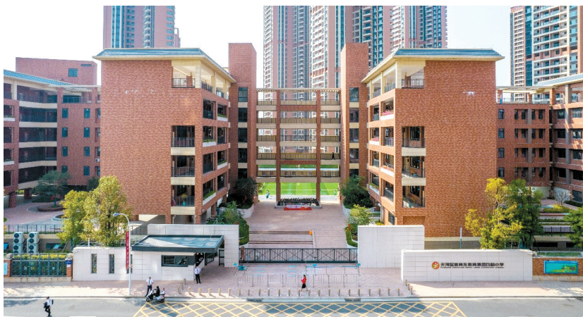
■天河区体育东教育集团均和小学实景图。