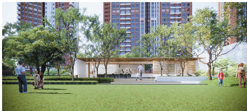
■珠江花城园林效果图。