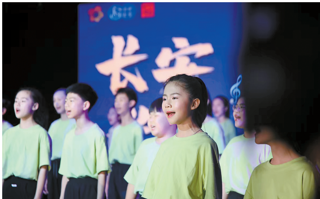
■3月23日晚,长安镇举行原创合唱组曲《长安长安》发布。

《长长的足迹》《蝶变》《潮涌大湾区》《聆听长安雨》《心安同一个梦》共五首歌曲分别以长安经济发展成果、生态美景、历史文化为创作题材,歌曲既有大气磅礴的时代旋律,也有悠长绵绵的深情诉说,包括童声合唱、混声合唱、男声重唱等形式。