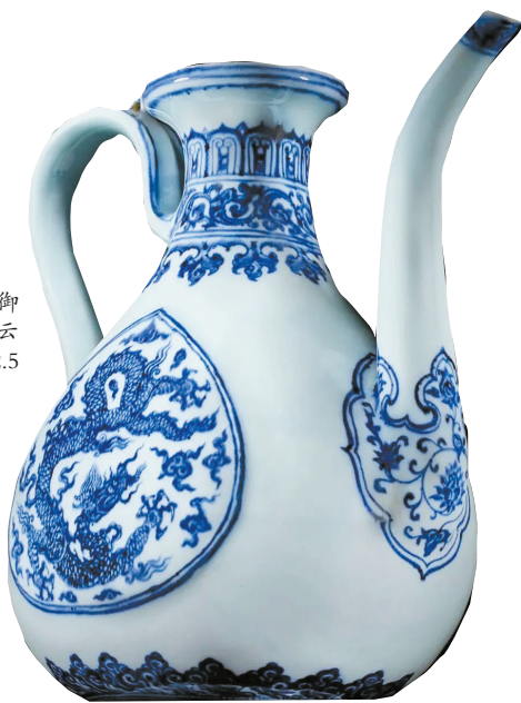
■明永乐,御制青花五爪云龙纹执壶,22.5厘米

在同代御用的金银器上,有类似壶式。“此式瓷壶寥若晨星,但在同代御用金银器上有见,例如梁庄王朱瞻垵墓出土的金壶,据铭乃由宫廷作坊御制,纪年洪熙(1425年),大小与此相若,壶腹两侧桃形设计也同。此式器形,宣朝应续沿用,美国费城艺术博物馆便有尤莫弗普勒斯旧藏金胎嵌宝执壶,壶腹桃式开光中同样鑲饰五爪云龙,想必与此青花执壶相类,乃皇家御器无误。”