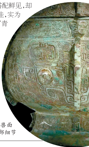
■商晚期,青铜兽面纹提梁盖卣,局部细节

卣乃祭祀酒器,始见于二里岗后期,其形多变,兴于商周。此卣器形经典,铸工精美,比例匀称,缀饕餮纹,辅以繁复装饰,其形与饰搭配鲜见,却两相呼应,华美绝伦,品相尤佳,实为罕珍。商代中叶,“安阳风格”青铜器于殷都(今河南省)地区始渐兴盛,本品即为此风格成熟至高之典例。此器早于1937年收录在黄濬专书,先后入飞利浦集团创始人之一的安东·飞利浦博士(1874-1951年)、戴润斋(1910-1992年)及罗马 Wahl-Rostagni 收藏,传承有绪。