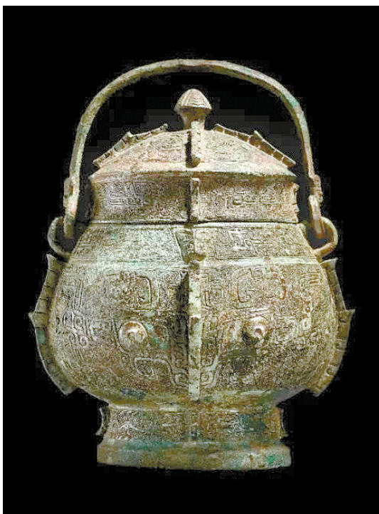
■商晚期,青铜兽面纹提梁盖卣,高28.7厘米,苏富比2023春拍