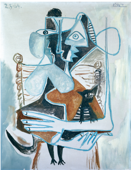
■毕加索《抱着猫的女子》