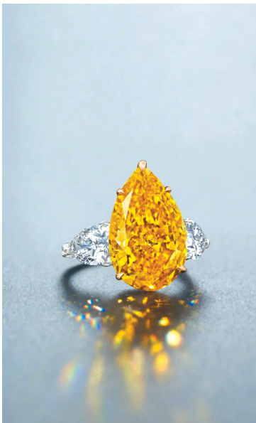
■THE GOLDEN FLAME 8.92 克拉艳彩黄橙色内无瑕钻石戒指