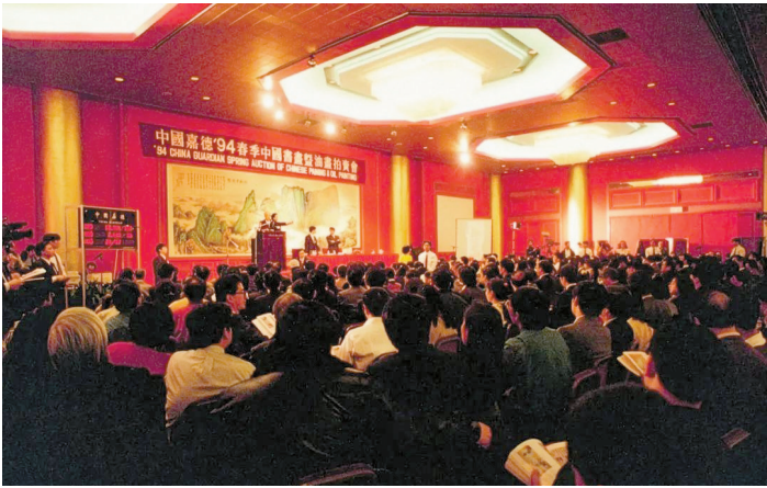
■1994年3月27日,中国嘉德首场拍卖会现场。