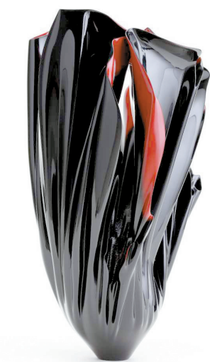
■生命之花,大漆,隗楠作品

收藏周刊: 这能否也可以理解为你的研究方向?或者再具体一点说,你会如何开展这部分的工作?