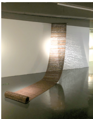
■《壁江村》,卷轴,750×6000cm,耐厚钢,2022

张亚平通过“种虚”,讲述的是生命互博后,在时间线索中互相抵消的自然法则。他不忍生命消逝,试图通过使用不同材质作为替代品,营造出自己对生命敬畏的纪念性。(梁志钦)