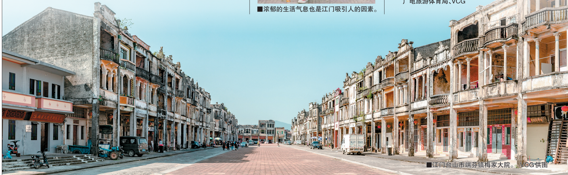
■江门台山市端芬镇梅家大院。