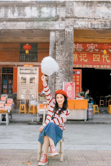
■浓郁的生活气息也是江门吸引人的因素。