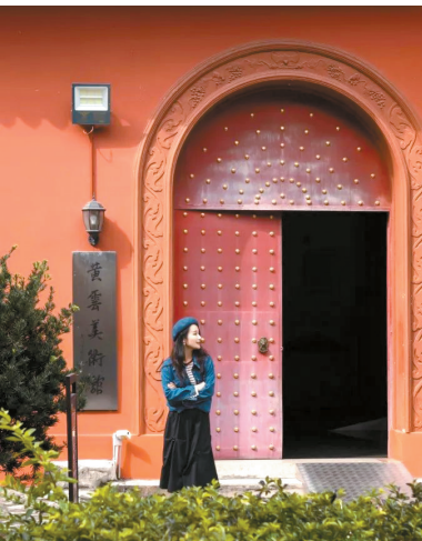
■走进江门的景区，文化气息扑面而来。