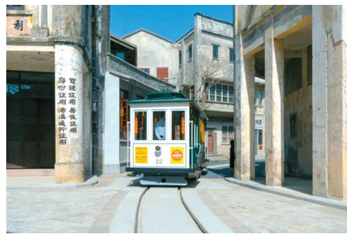
■赤坎古镇更像一个影视城。