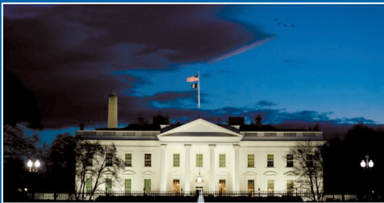
■这是1月20日在美国首都华盛顿拍摄的白宫。

截至4月7日,各方对文件真假看法不一。美国司法部宣布展开调查,乌克兰政府召开高级别紧急会议。如果文件属实,意味着美方在俄乌冲突中介入程度之深以及以提供情报来支持乌克兰的力度,比以往所知的更甚。