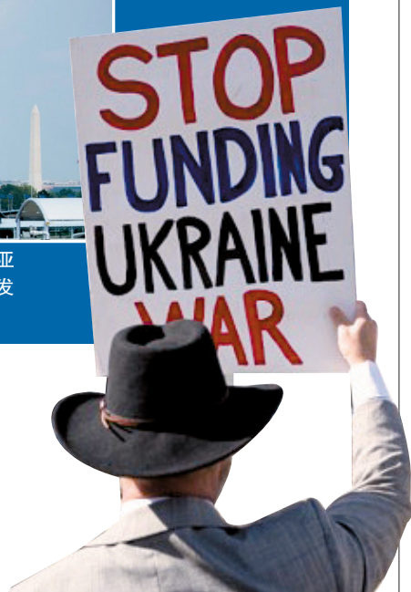
■2月19日,在美国首都华盛顿,一名抗议者手举标语在林肯纪念堂前参加集会。