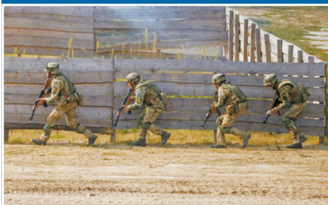
■2020年9月17日,乌克兰士兵参加在乌克兰西部利沃夫州举行的代号为“快速三叉戟-2020”的多国联合军事演习。