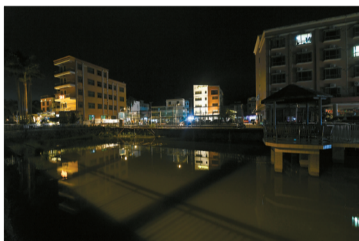
◀夜晚的西涌社区新屋村一隅。