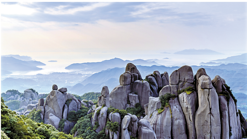
太姥山景区(国家级5A景区) 地址:福建省宁德市福鼎市南

如果体力和时间允许,登上峰顶,但见眼前星罗棋布的岛屿,风光旖旎的海湾,碧波万顷,风帆点点,瑰奇壮丽,确然当得起“山海大观”之称。