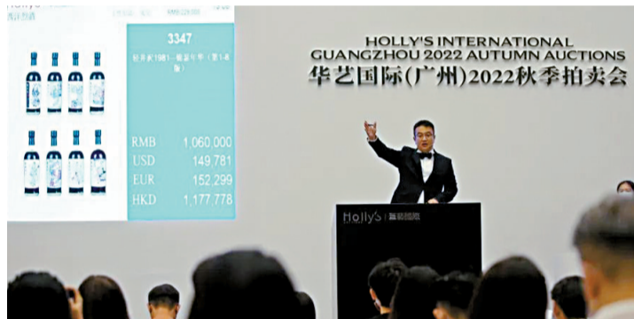
▲华艺国际(广州)2022秋季拍卖会,总成交额逾3.35亿元圆满收官,图为拍卖现场。