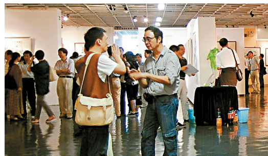
■金雅轩画廊举办的展览现场。