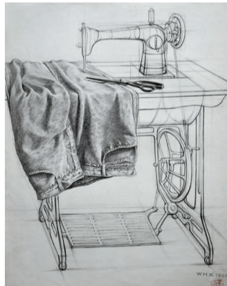
缝纫机 1989年 设计素描 60×43cm