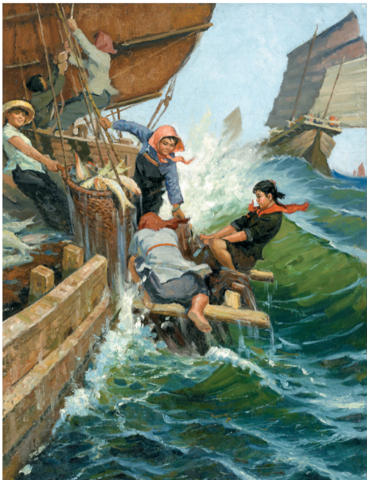
“三八号”的丰收 1960年 布面油画 148×106cm 广州美术学院美术馆藏

作为吴华先的学生,广州美术学院李正天教授评价说,“这画不仅构图奇特,而那些女儿们在这种紧张危险状态下体现出来的美,实在最不易把握。”