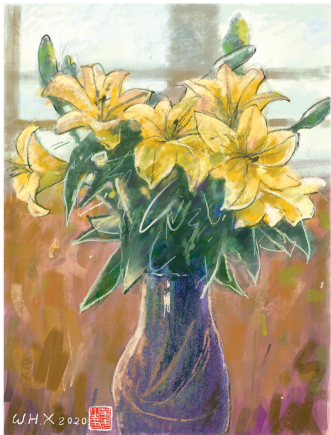
黄百合 2020年 数字板绘 79×59cm