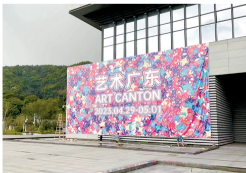
■2023艺术广东将于4月29日-5月1日在佛山南海樵山文化中心举行。