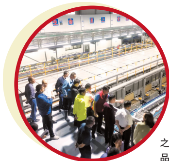
■与会人员到大沙镇参观肇庆奇乐之仁堂饮料食品有限公司。

新快报记者了解到,2021年6月以来,肇庆市充分利用省直机关、佛山市场、肇庆自身三种帮扶力量,积极开展驻镇帮扶扶村工作,取得良好成效。如积极发挥佛山市场、产业、人才等优势,引导佛山市场企业力量参与肇庆产业发展,佛山驻肇庆帮扶指挥部组织300多批次佛山企业赴肇调研考察、洽谈项目,引入佛山社会资金近30亿元,不仅壮大肇庆帮扶产业,同时增强佛山企业发展后劲,实现两地共赢。