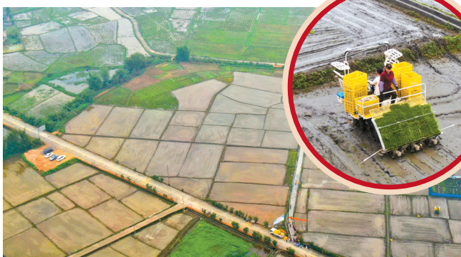
■小三江镇将越来越多的专业知识和设备运用到农业生产中。