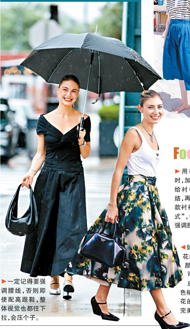
▶一定记得要强调腰线,否则即使配高跟鞋,整体视觉也都往下拉,会压个子。