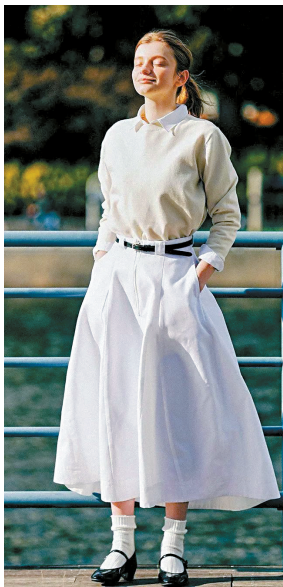
▲有口袋的款式更多点儿轻松感,非常适合拍照时手不知道放哪里的时髦精。