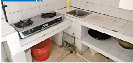
■厨房十分陈旧,有大片黑色污渍。