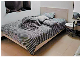
■上一位住客留下的凌乱床铺没有整理。