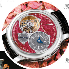
■第二代 F.P.Journe Tourbillon Souverain 腕表

精致名表方面,“极致系列”将于5月26日在香港会议展览中心上拍。这个系列中的每枚時計不但在腕表历史中别具意义,而且状况完好,部分甚至仍未开封。该私人藏家在过去20年一直悉心搜罗,当中包括传奇制表品牌最备受渴求和难得一见的款式,例如百达翡丽、爱彼、劳力士和朗格等。此外,亦带来著名独立制表工匠的杰作,包括被誉为“最伟大在世制表工匠”的F. P. Journe,以及于2022年日内瓦高级钟表大赏上备受嘉许及由“腕表兄弟”主理的得奖品牌Grönefeld。(潘玮倩)