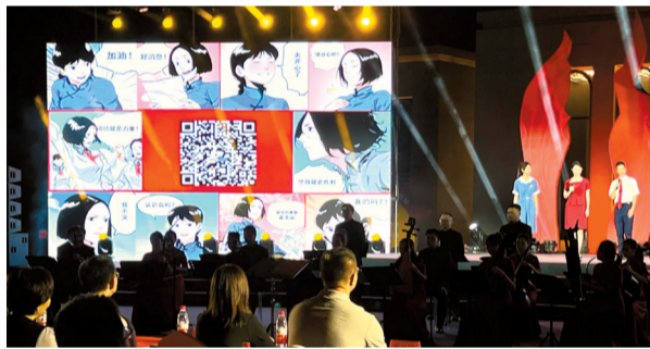
■活动现场。

晚会分为红色信仰篇、红色基因篇和红色传承篇,12个节目环节精彩纷呈。其中,在红色基因篇,讲解员带领学生“走进”了博物馆,欣赏沉浸式话剧、木偶剧、音乐会,参与思政实践能力竞赛、文物修复知识课。广东音乐曲艺团、广东木偶剧院演出的《广州起义组曲》片段、木偶剧《游曦》片段,以艺术形式鲜活再现了革命历史。广