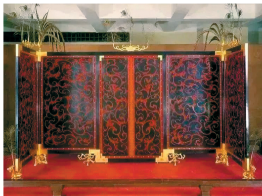
■漆木屏风(复原件),西汉南越国时期,1983年南越文王墓出土,南越王博物院藏