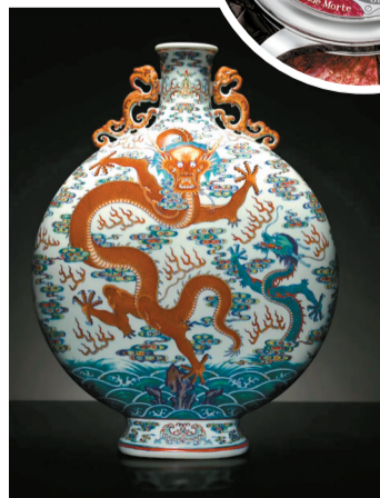
■清乾隆斗彩苍龙教子图夔龙耳抱月瓶