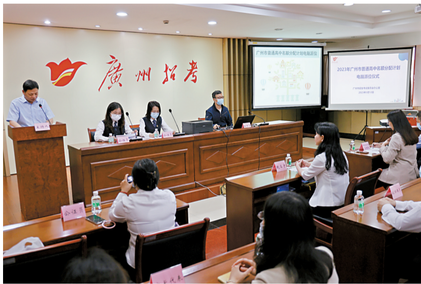
■广州市普通高中名额分配计划电脑派位仪式昨天举行。

记者了解到,名额分配招生采用单独批次、单独录取的招生办法,安排在第二批次,设3个志愿,与其他批次志愿同步填报。符合名额分配报考资格的考生,无论是否办理跨区,都只能填