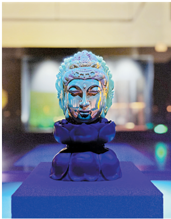
■蓝珀佛首,多米尼加,深圳市宝安区世纪琥珀博物馆藏。