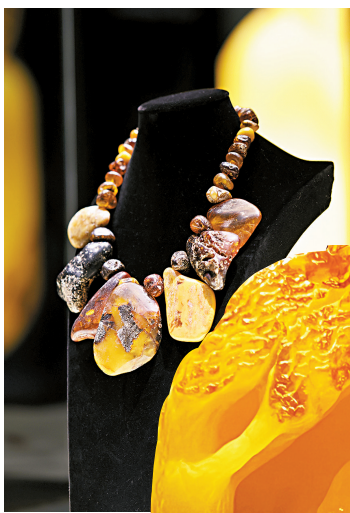
■琥珀饰品,波罗的海