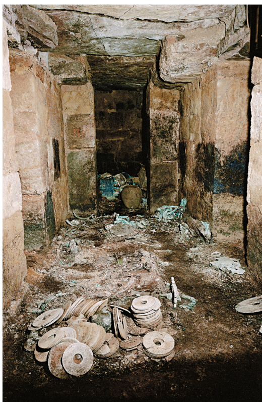
■南越王墓主棺室出土情形。