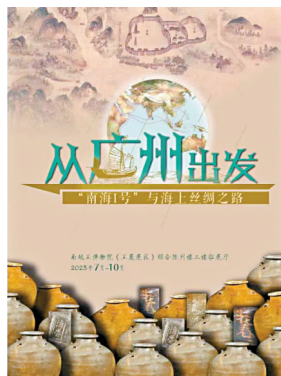
海报来自南越王博物院微信公众号