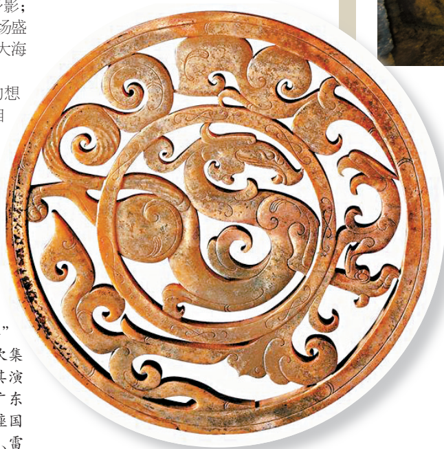
■南越王墓出土的透雕龙凤纹重环玉佩。