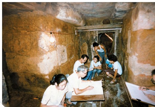
■发掘人员在测绘主棺室平面图。