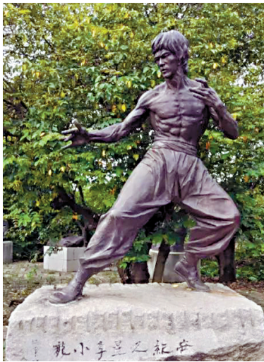
■《世纪之星李小龙》曹崇恩