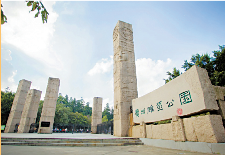
■《华夏柱》(花岗岩群雕)

为继续推进《广东雕塑现状调研》进一步细化,收藏周刊记者走访发现,在广州市内,已经建成以雕塑为主题的园区已经有多座,包括广州雕塑公园、广东美术馆潘鹤雕塑园和位于海珠区的潘鹤雕塑艺术园、广州美术学院梁明诚雕塑园、唐大禧雕塑园和曹崇恩雕塑园等,此外,还有不少街区较为集中展示雕塑作品,包括花城广场、沙面公园、上下九路步行街等。