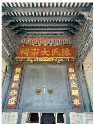
■“貽謀光潁水,燕翼裕沙溪”既不忘家族源流颍川之水,又不负沙滘(溪)接纳养育之恩。

日光照射下的瑞兽形象投射到房梁上,栩栩如生的光影真的有如祠堂安宁的守护兽,令人叹为观止。