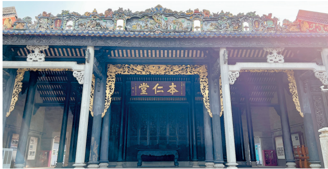
■沙滘陈氏大宗祠也称广州陈家祠的“姊妹祠”。