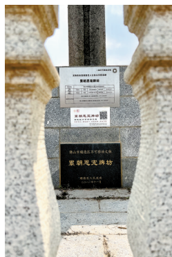
▲“累朝恩宠”牌坊是顺德罕有的明代牌坊。