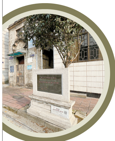
■清末民初时期的华侨建筑群“牧伯里古建筑群”。

在佛山顺德乐从沙滘,有一家可媲美广州陈家祠的陈氏大宗祠本仁堂,这是广东两间最大祠堂之一。