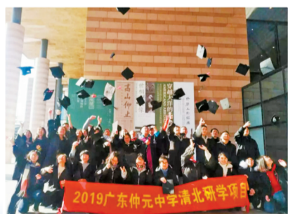
参加清北研学项目