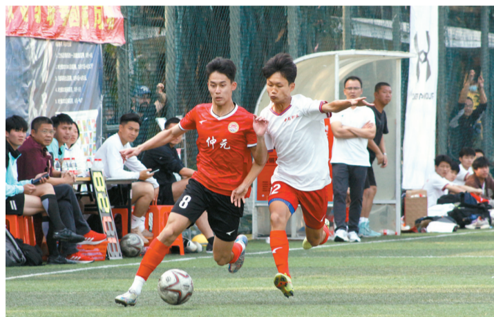
驰骋赛场,用实力说话。