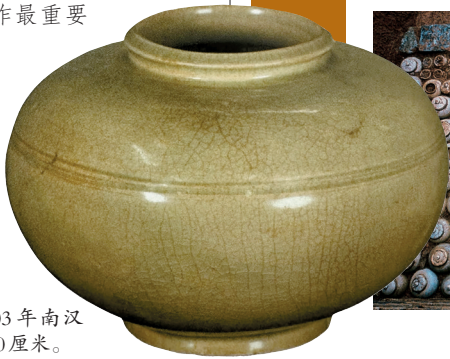
►青瓷罐,2003年南汉德陵出土,高10厘米。