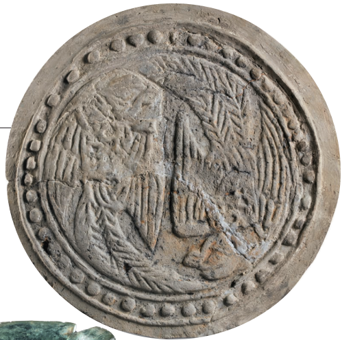
▲双凤纹瓦当,2003年南汉康陵出土,直径13.0,边轮宽0.6,厚1.6厘米。

南汉康陵是我国首次发现的五代十国时期陵园建筑,其营建形式特别,圜丘形陵台形制独特,为我国古代陵寝制度的研究提供了重要实例。