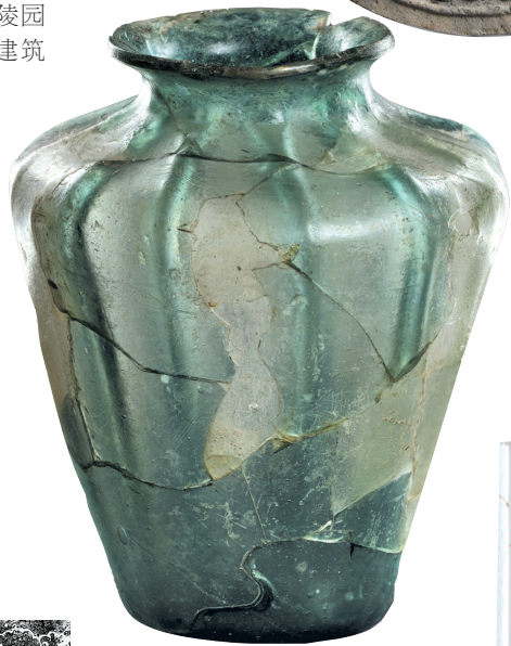
▲玻璃瓶。2003年南汉康陵出土,高12.2,口径5.3-5.5,底径4.7-5.0,壁厚0.1厘米。