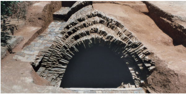
■德陵墓室券顶外壁