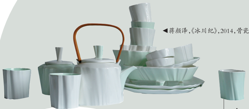
▲蒋颜泽,《冰川纪》,2014,骨瓷