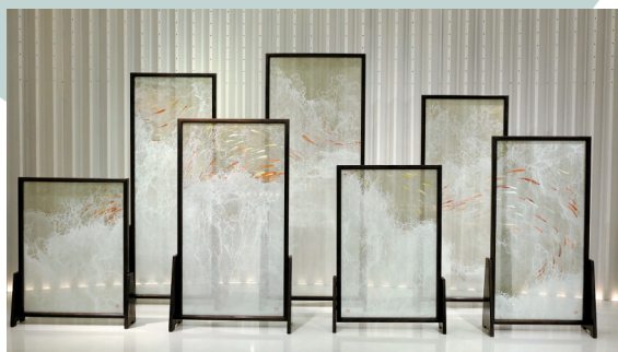
■姚建萍,《鱼跃飞浪 屏风》,2021,丝线、丝绸