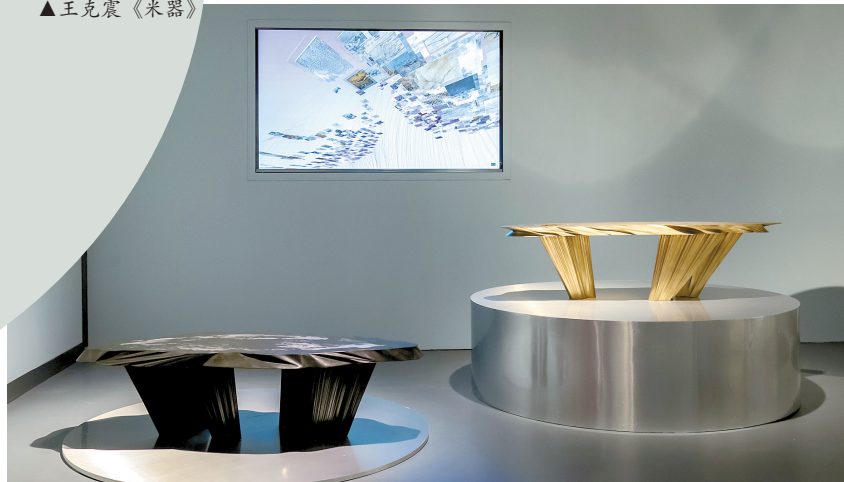
■李世奇,《人工自然家具系列》,2022,石材、铜、石几