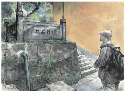
■抱朴道院炼丹古井(写生作品)