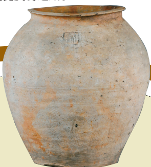
■印布纹陶瓮 西汉中期 (“大厨”戳印铭文)