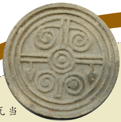
■云纹瓦当 西汉前期