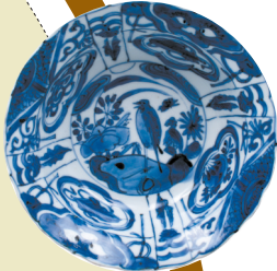
■青花花鸟纹碟 明万历