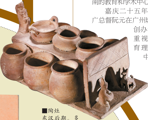
■陶灶 东汉后期。多眼灶在汉代并不多见,岭南先民在此基础上创造出节能灶,上面煮食,两侧温水,或者利用火门温热房屋,体现岭南人在煮食行为上的环保节能创新。