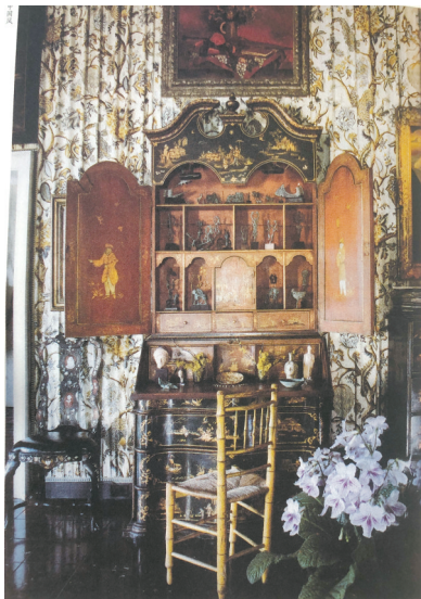
■一个洛可可式混搭风格的房间:墙壁上挂着印度花卉的棉布帷幔,与黑色水磨石地板和黑漆镶板的中國風櫥櫃相得益彰,還有一條18世紀的威尼斯角凳和一把葡萄牙竹椅。

同期的丹麦,也被发现有了仿制漆器的风潮。在哥本哈根的玫瑰宫里有一个房间,里面的嵌板大部分表现的都是中国式帆船。“在欧洲其他地方,东方装饰的风潮盛行一时”。昂纳如此写道。