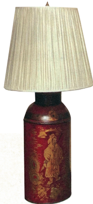
■乔治四世时代的一座中国风茶叶罐造型的台灯,约1795年。

画中出现的种种——庄严的僧人和佛像,谄媚的朝臣,虔诚的信徒,漂浮在半空的阳伞式华盖,官吏形象的胸像柱,朝向天空的庙宇很快成为中国风的基本元素。