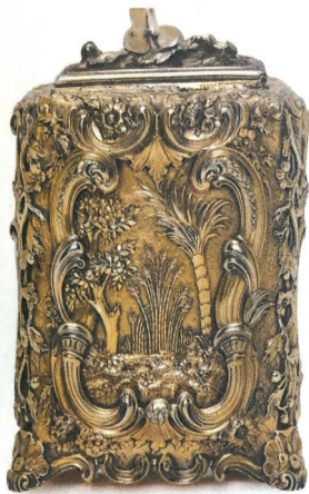
■乔治二世时期的镀金银质中国风茶叶罐。