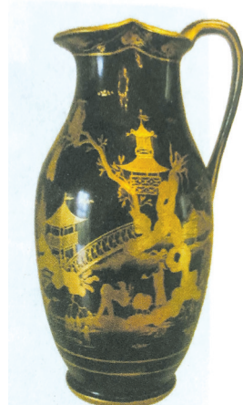
■1799年维也纳生产的瓷酒壶,装饰模仿中国的漆器。