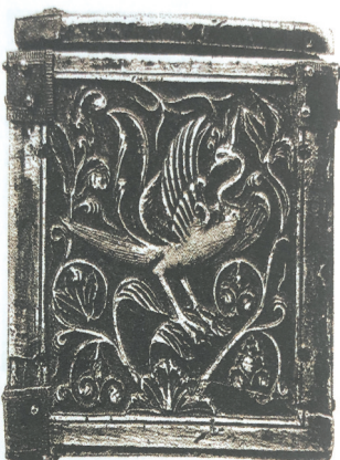
■中国风的开端:11世纪拜占庭象牙珠宝箱。