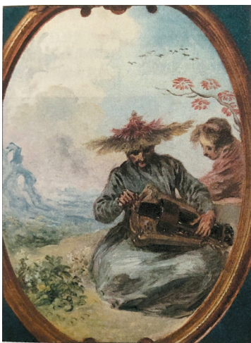
■华托创作的版画,画中人物身着中式服装,有浓郁的东方情调。