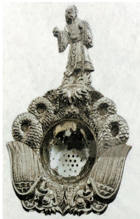
■铸银滤网,手柄上雕有中国龙的形象,意大利,19世纪末期。