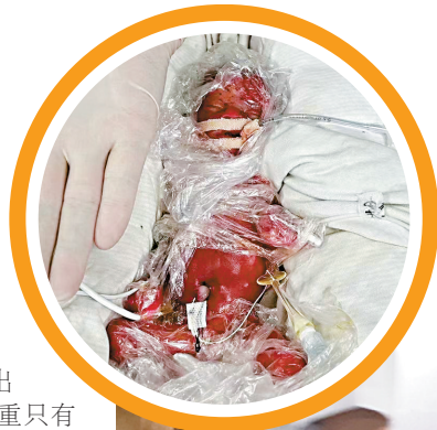
■年年出生时与出院时的状态相差很大。