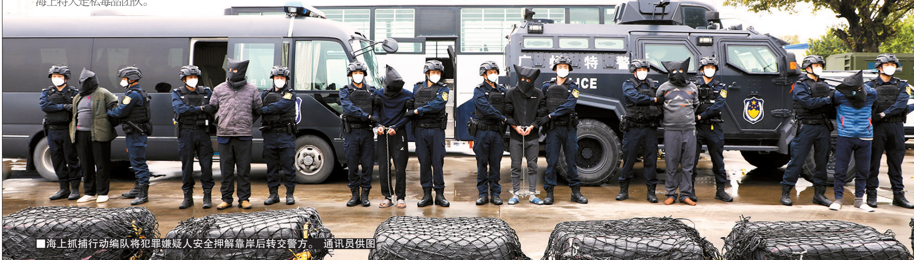
■海上抓捕行动编队将犯罪嫌疑人安全押解靠岸后转交警方。