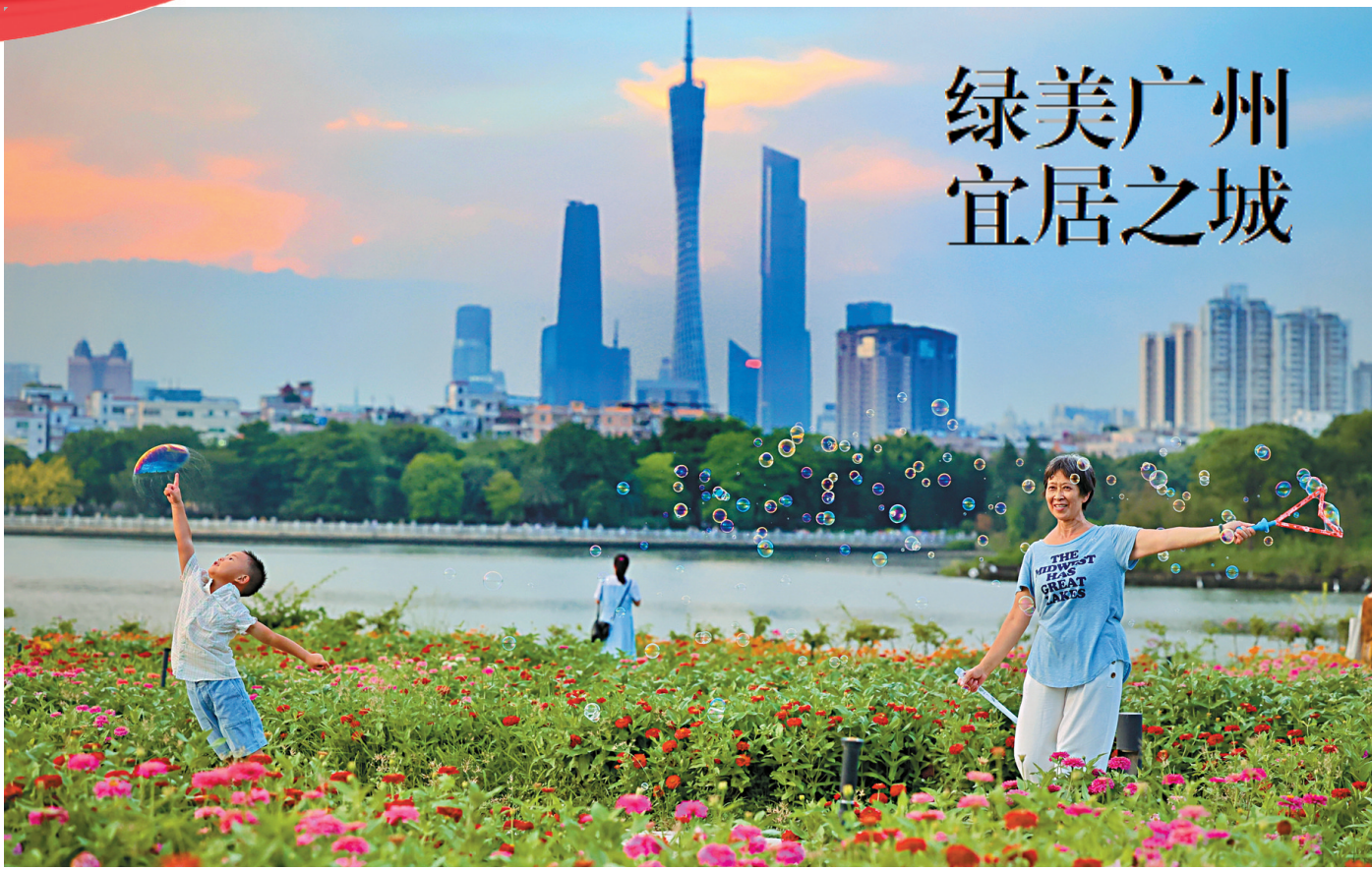
▲海珠湖公园内，市民在花丛中赏花游玩，尽情享受城市美景和休闲时光。