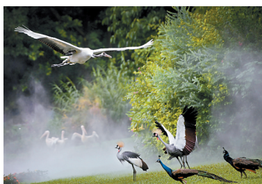
▶番禺一处飞鸟乐园内，各种鸟类自在飞翔，像是晨雾中的舞者，美丽动人。