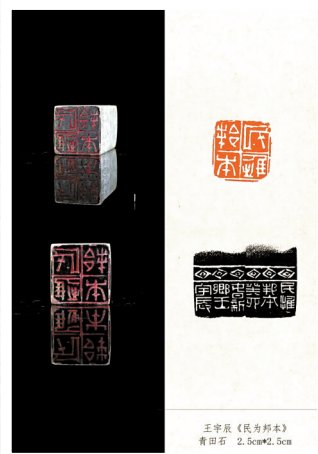
王宇辰《民为邦本》 青田石 2.5cm*2.5cm